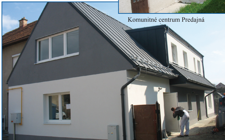
Komunitné centrum Predajná

Treba si uvedomiť, že toto riešenie nepredstavuje zníženie koncentrácie alebo množstva znečisťujúcej látky v prostredí. Je však krokom, ktorým sa zníži riziko úniku znečistenia do prostredia. Trvalým riešením bude sanácia oboch skládok, čo bude možné zrealizovať až po verejnom obstarávaní, ktoré je v rukách Ministerstva životného prostredia SR, a ktoré ho postúpilo na Úrad pre verejné obstarávanie po vznesení pripomienok uchádzačmi. Pán minister Budaj ma telefonicky kontaktoval