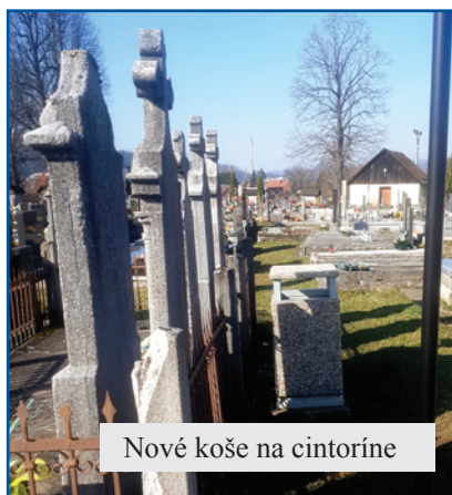
Nové koše na cintoríne