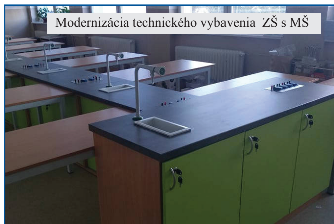
Modernizácia technického vybavenia ZŠ s MŠ