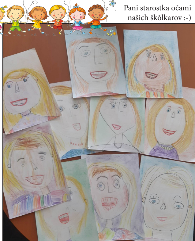
Pani starostka očami našich škôlkarov :-)