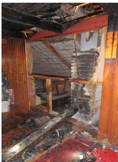
Trám prechádzajúci cez komínové teleso