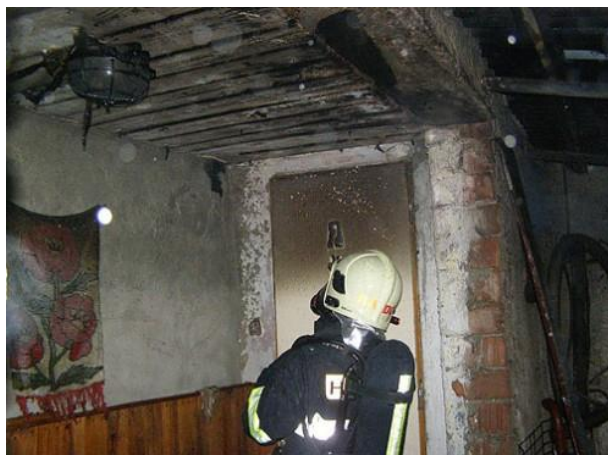
Požiar v priestore povaly spôsobený komínovým telesom