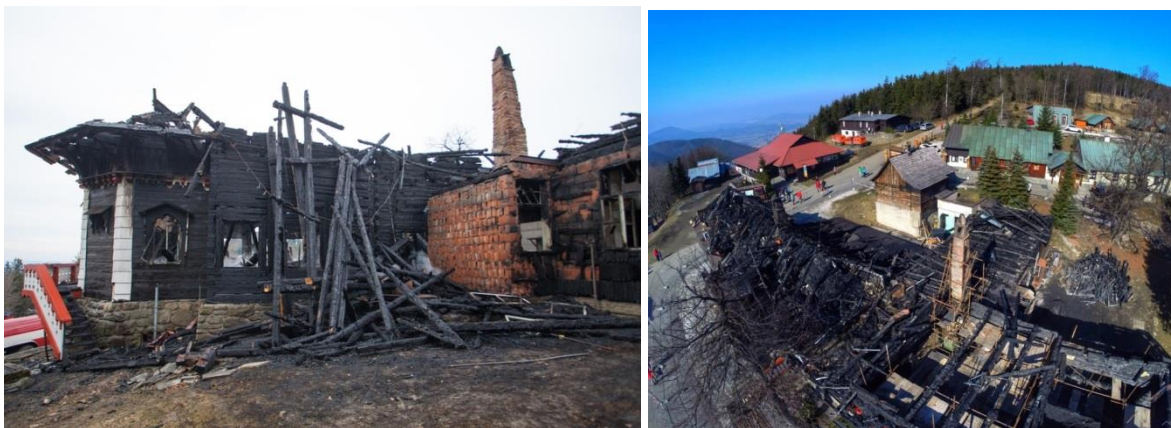
Požiar chaty, ktorého príčinou bolo komínové teleso