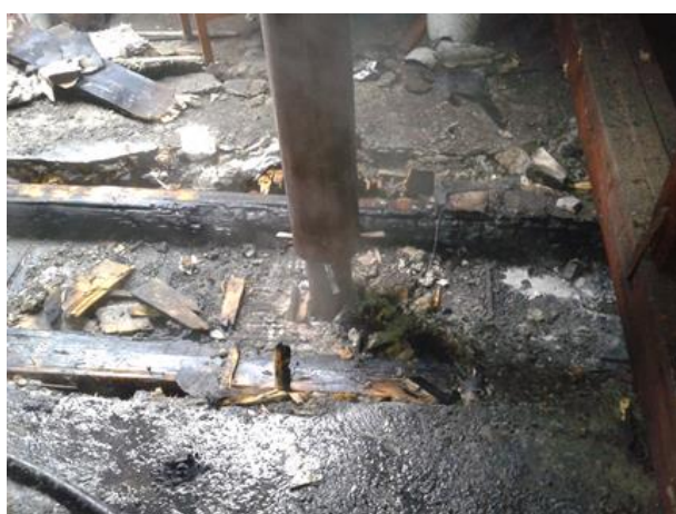
Nesprávne vyhotovený komín v mieste prechodu cez stavebnú konštrukciu