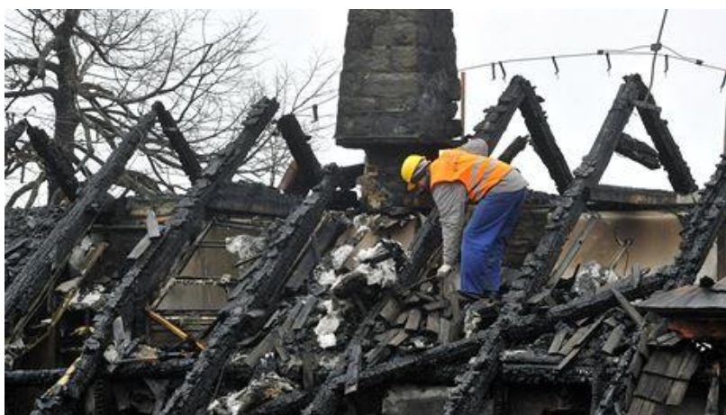
Požiar strechy spôsobený komínovým telesom